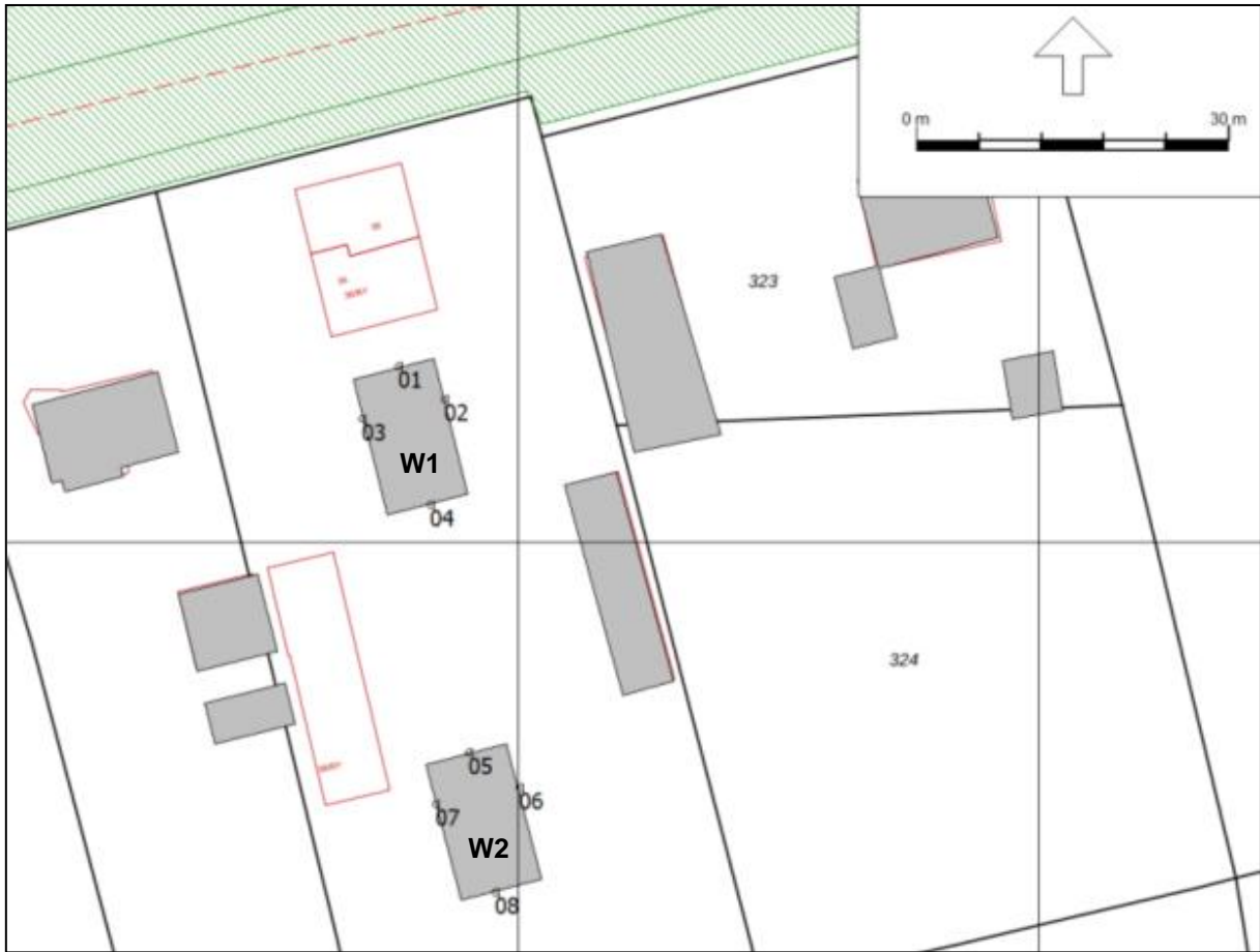
Figuur 2: Ontvangerpunten